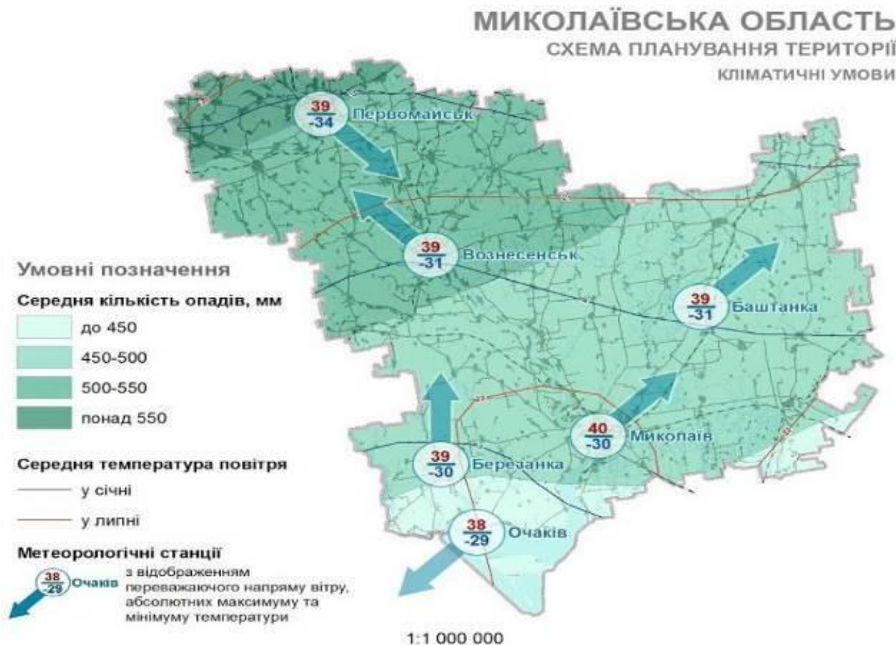
Рисунок 2.3 – Кліматичні умови Миколаївської області