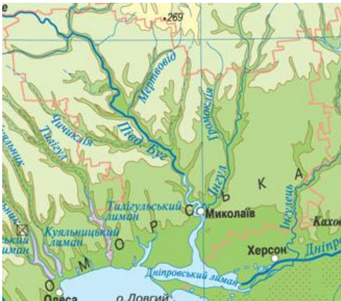
Рисунок 2.2 - Фізична карта Миколаївської області

За особливістю природних Миколаївська область розташована в межах двох фізико-географічних зон – лісостепової (Кривоозерський і західна частина Первомайського району) і степової (решта території).