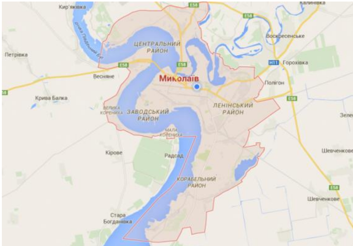
Рисунок 2.1 – карта міста Миколаїв

Місто Миколаїв — місто в Україні, обласний центр Миколаївської області, центр Вітовського і Миколаївського районів. Миколаїв розташований в Північному Причорномор'ї в гирлі річки Інгул, де вона впадає до Південного Бугу, за 65 кілометрів від Чорного моря. Це потужний політичний, діловий, індустріальний, науково-технічний, транспортний та культурний центр. Площа міста за даними голосного управління статистики в миколаївській області станом на 01.01.2019 складає 259,8 км 2 .