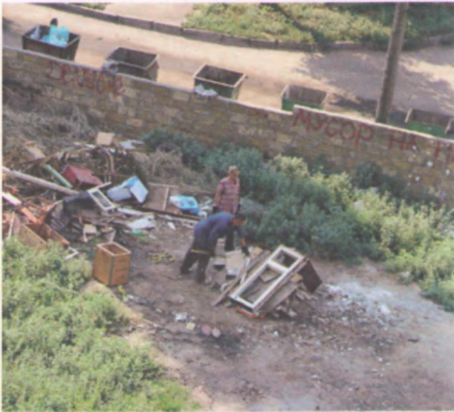
Таким майданчик був років десять назад.