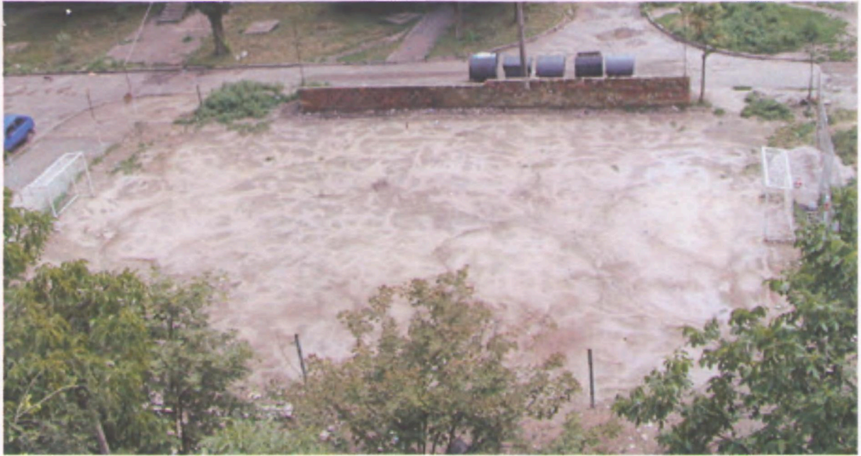
А це сучасний вигляд футбольного ґрунтового поля. Є ворота і сітка рабіца навкруги.