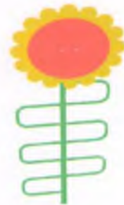
Балансири на пружині та балансир-качалка