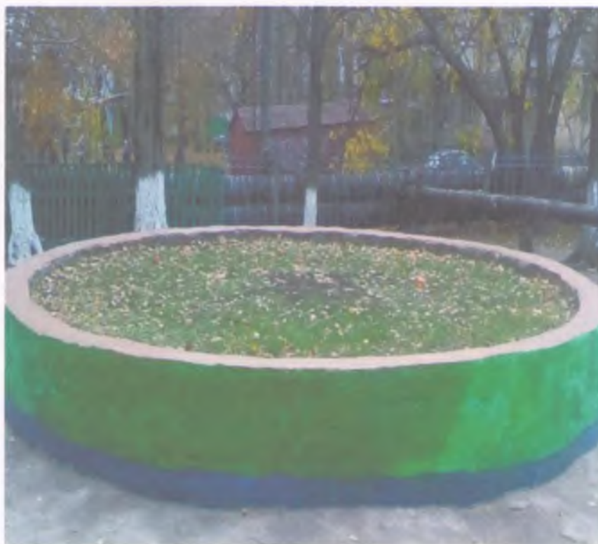
Клумба «Весела квітка»

Кожна пелюстка зроблена з різного матеріалу (дерево, пластмаси, трава, пісок, камінь та інші).