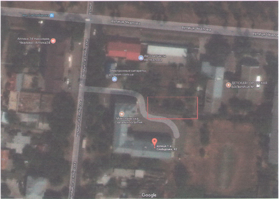
в) інші матеріали, суттєві для заявника проекту (креслення, схеми тощо)