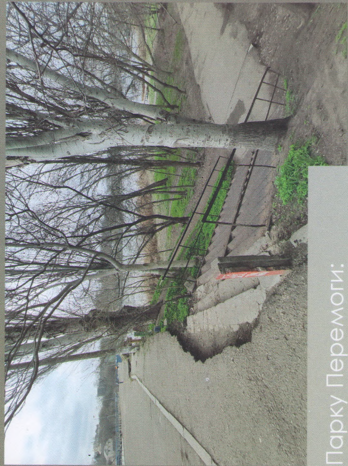
Поточний вигляд сходів до Парку Перемоги: іржаве залізо, аварійні тополі, понівичене покриття, випотпаний лодьми «пандус»