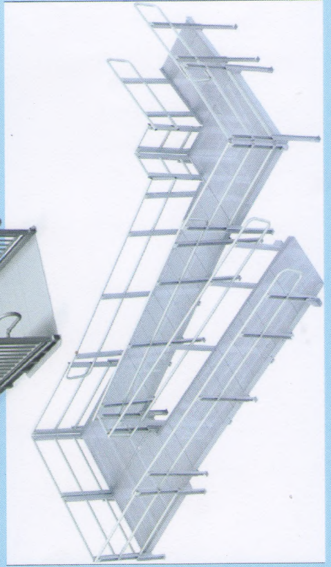
Візуалізація запропонованого рішення та приклади модульних конструкцій пандусів